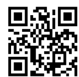
出願から入学までの流れ データ版募集要項・学校書類(転編入用)